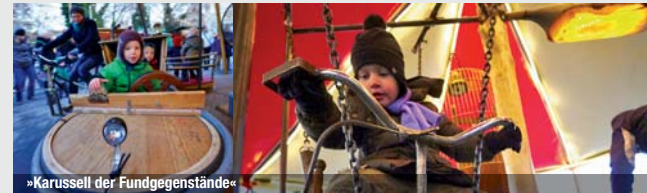
»Karussell der Fundgegenstände«

Samstag & Sonntag, 31. August & 1. September 2013 12.00, 14.00 und 16.00 Uhr: