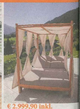
€ 2.999,90 inkl.

Elementry GmbH, Ort 221, 5552 Forstau, Tel. 0664/79 38 248